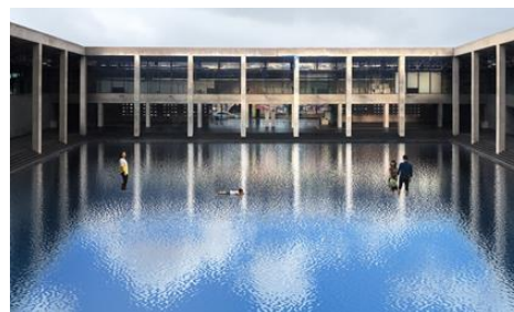
Palimpsest: 空の池 | レアンドロ・エルリッヒ

過疎高齢化が進む日本有数の豪雪地・越後妻有を舞台に2000年から3年に1度開催されている人間の土地と美術の芸術祭です。「人間は自然に内包される」を基本理念に、アートを媒体として地域に内在するさまざまな価値を掘り起こし、その魅力を高め、地域再生の道筋を築くことを目指しています。